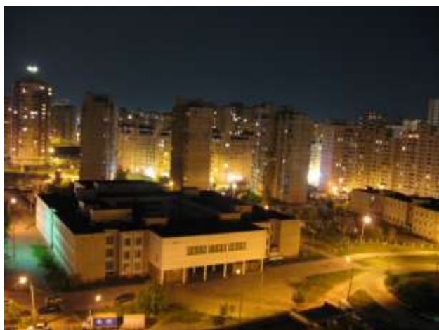
Школа №314 (сейчас)