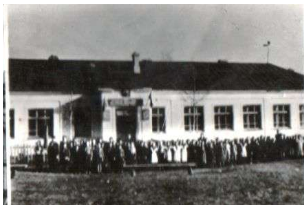
Школы во время ВОВ